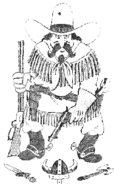
The SWS marshal Illustrasjon: Wild Bull

12.1 Det viktigste er at deltakere i SWS-stevner skal være trygge innenfor sikkerhetsregler, ha det moro, utvikle sine skyteferdigheter og oppleve de rike tradisjoner som er bundet til "Det Gamle Vesten". Vi ber om at du deltar sammen med oss i å ivareta disse tradisjonene og med en positiv konkurranseånd.